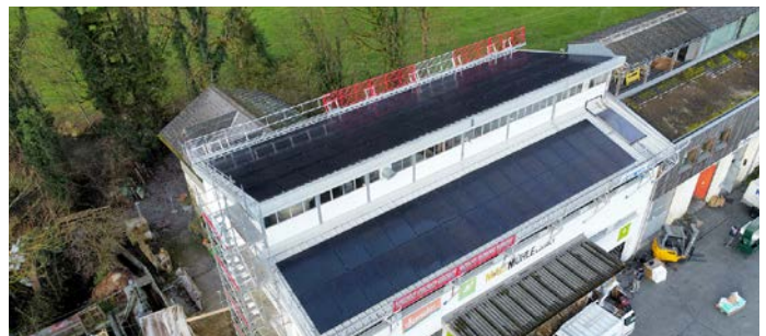
Montage einer Photovoltaikanlage im Glarnerland

Bereits gegen Ende des Jahres 2025 zog die Nachfrage nach Photovoltaikanlagen in Kombination mit Batteriespeichern und Automationslösungen wieder spürbar an. Wir hoffen, dass sich diese positive Entwicklung im kommenden Jahr fortsetzt.