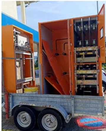
Alte Mittelspannungsanlage mit Niederspannungs-Verteiler der Trafostation Chastli

Dank unseres 24-Stunden-Pikettendienstes konnten im vergangenen Jahr eine Netzstörung sowie sieben Störungen an Hausinstallationen rasch behoben werden.