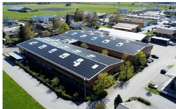
Zweite Etappe der Photovoltaikanlage bei STS Systemtechnik GmbH

Per Ende 2025 waren 296 Photovoltaikanlagen auf den Dächern in Schänis installiert, gegenüber 270 Anlagen im Jahr 2024.